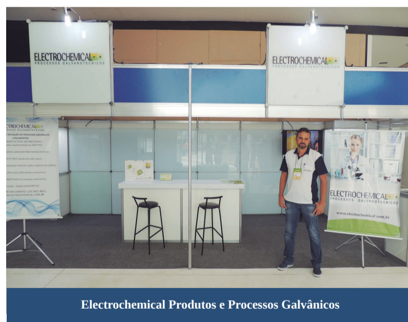
Electrochemical Produtos e Processos Galvânicos