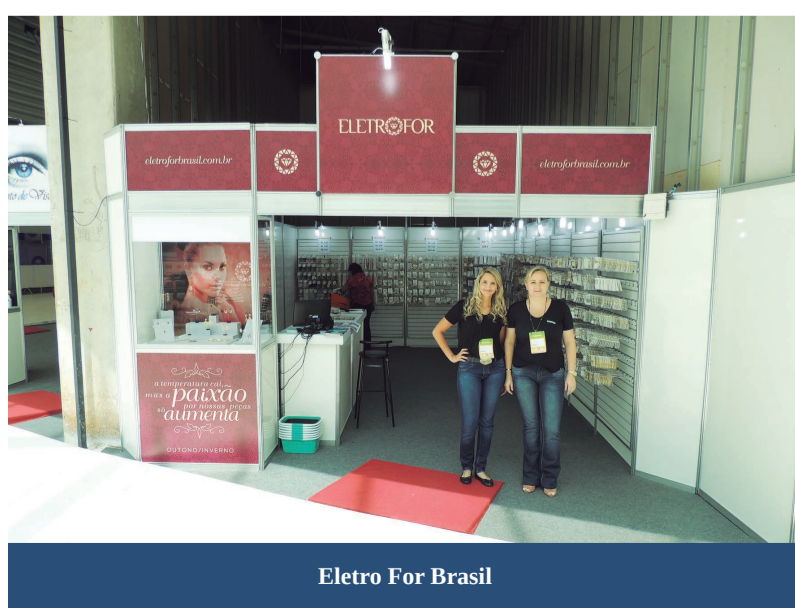
Eletro For Brasil