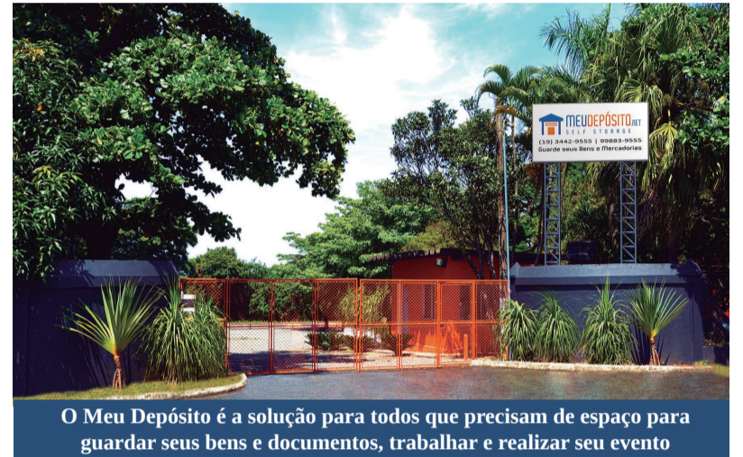
O Meu Depósito é a solução para todos que precisam de espaço para guardar seus bens e documentos, trabalhar e realizar seu evento