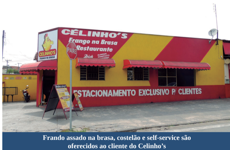
Frango assado na brasa, costelão e self-service são oferecidos ao cliente do Célinho's