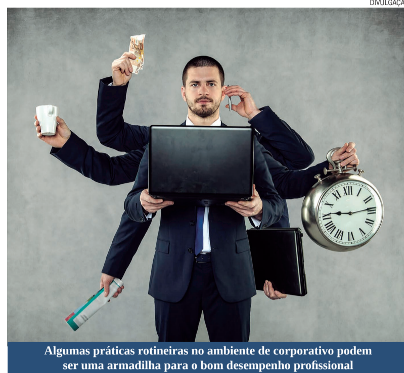
Algumas práticas rotineiras no ambiente de corporativo podem ser uma armadilha para o bom desempenho profissional

Quem acha que toda mudança vem para cortes e perdas, está com destino marcado - dificilmente terá melhorias de produtividade e de resultados